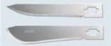
Lame disecție pentru F60 Cod 205600001 No 61 (late) Cod 205600002 No 62 (înguste)