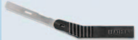
Mâner fasonare F80 mini Cod 205570000