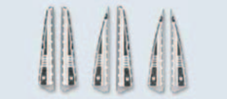
Vârfuri pentru foarfecă autopsie 145 Cod 208000155 bont/ascuțit Cod 208000156 bont/bont Cod 208000157 ascuțit/ascuțit