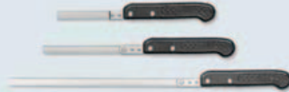
Mânere fasonare F80 P - Cod 205550001 F130 P - Cod 205530001 F260 P - Cod 205540001