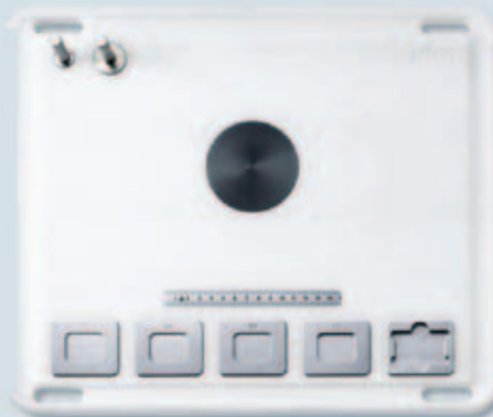
Trusă disecție Cod 040600