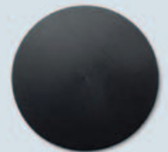
Adaptor (negru) Cod 040350