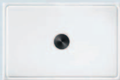
Placă reducție probe Cod 040700