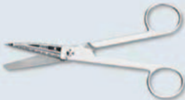
Foarfecă autopsie 145 Cod 208000055 L=155 mm